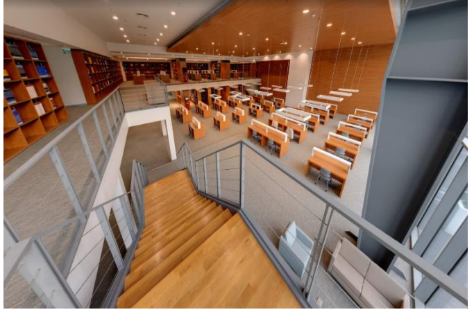
Tablo 6. Kütüphane Alanları

Fiziksel açıdan geniş ve konforlu bir mekâna sahip olan kütüphane, 2554 m 2 kapalı alanı, 600 kişilik oturma kapasitesi, 17 bireysel ve 2 grup çalışma alanı, 2 bilgisayar laboratuvarı ve açık terasıyla kullanıcılarına modern bir öğrenme ortamı sunmaktadır.